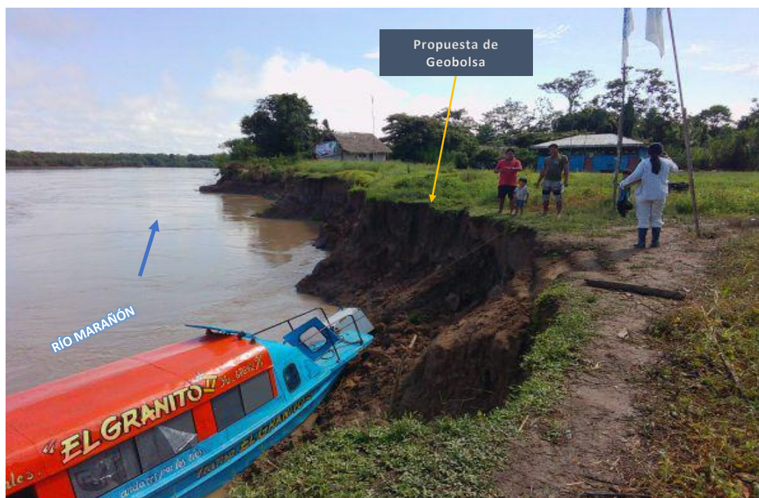
FIGURA N°01: VIVIENDAS EXPUESTAS Y RIBERAS AFECTADAS POR LA EROSIÓN FLUVIAL