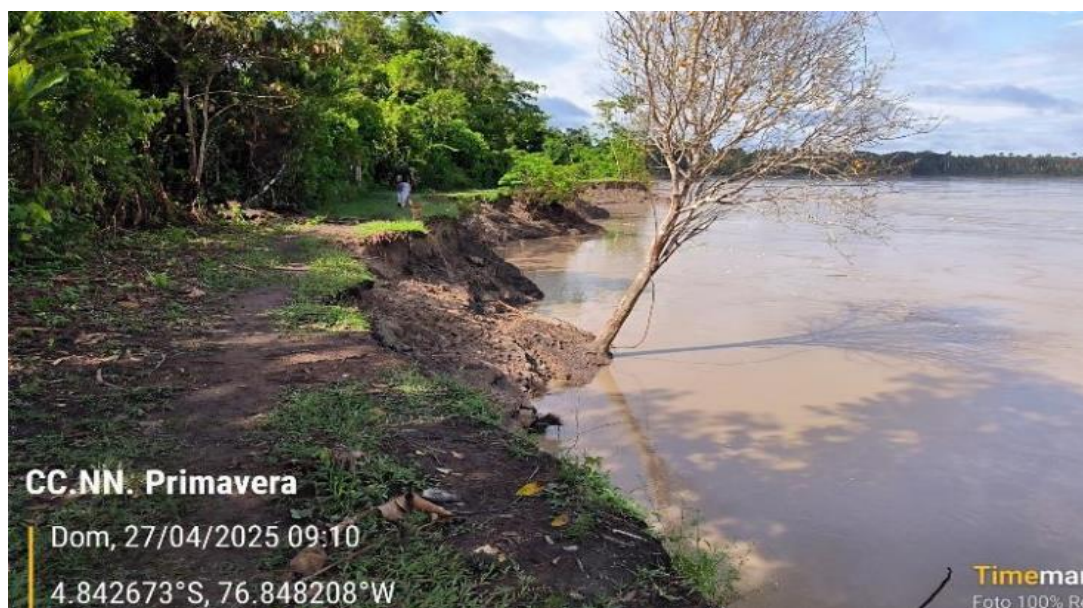
FIGURA N°02: ÁREAS DE CULTIVO EXPUESTAS Y RIBERAS AFECTADAS POR LA EROSIÓN FLUVIAL