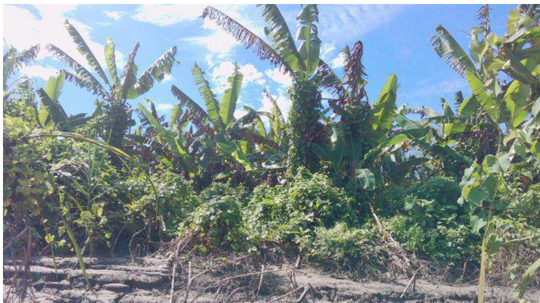
FIGURA N°03: ÁREAS DE CULTIVO AFECTADAS POR LAS INUNDACIONES